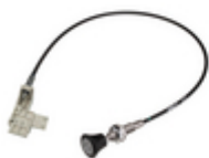
Mechanical remote control