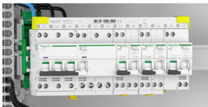
Image of assembly of product