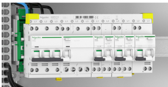
Image of assembly of product